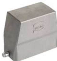
Ref: 19 44 310 0547 Capota con salida lateral M32