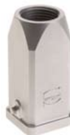
Ref: 19 44 003 1443 Capota salida recta M20 con junta encolada