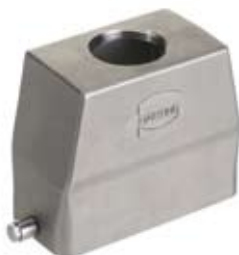
Ref: 19 44 310 0447 Capota con salida recta M32