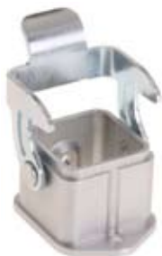
Ref: 19 44 003 0301 Base a empotrar