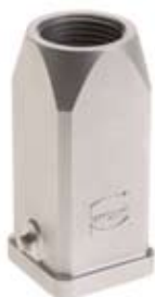
Ref: 19 44 003 1440 Capota salida recta M20