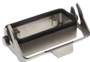
Ref: 19 44 310 0305 Base a empotrar